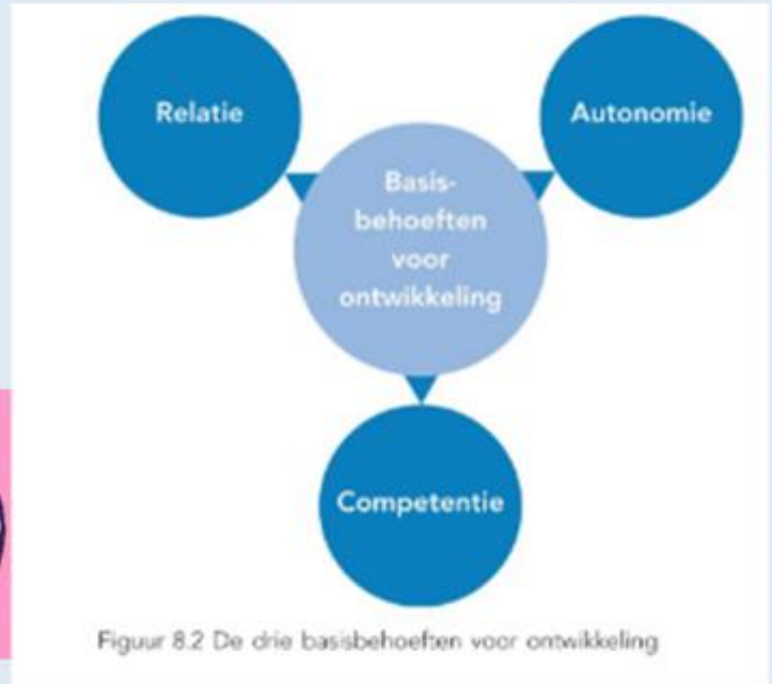
Figuur 8.2 De drie basisbehoeften voor ontwikkeling